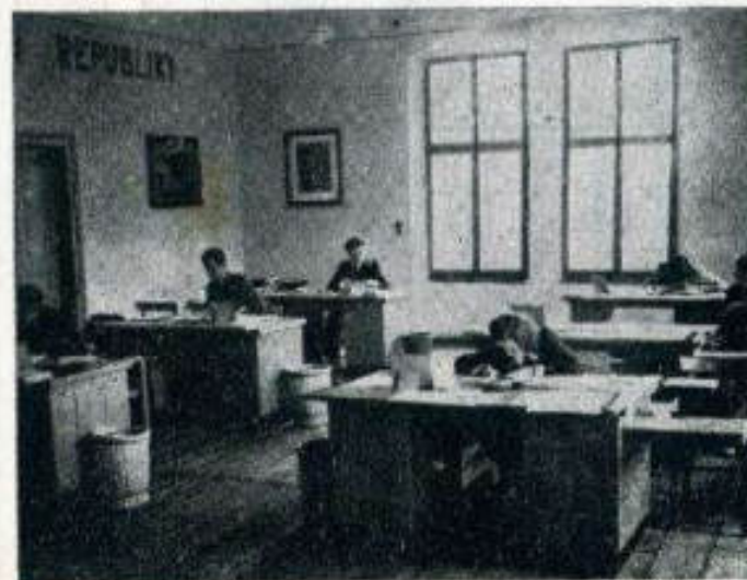
Dva pohledy na soutěž podnikové dospělosti