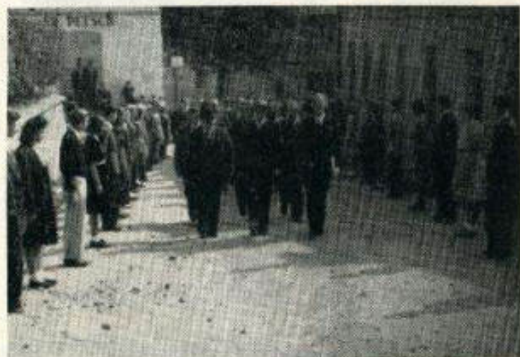
Cestou k budově nové obchodní akademie

Celkem vyzněla slavnost jako projev spontánní radosti a díky Vimperka a celého kraje nad tím, že se podařilo uskutečnit pro celou oblast dobré