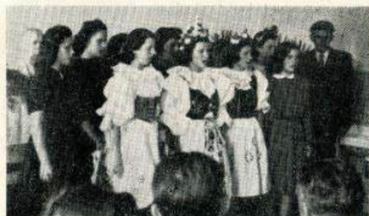
Ze studentského programu slavnosti