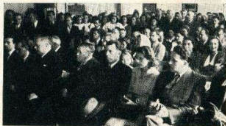
V slavnostní síni ústavu

Po dnu slavnosti přišly dny práce, neboť ústav jest si plně vědom svých úkolů a chce jim plně dostát!