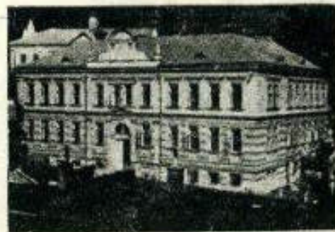
Budova obchodní akademie ve Vimperku

Rok 1947 jest nyní dalším důležitým mezníkem v dějinách našeho ústavu. Dnem 1. září 1947 reorganisovalo ministerstvo školství a